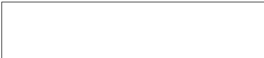
図1 ○○州における生徒数の推移